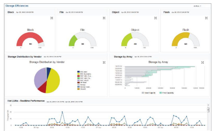
Рис. 1. Консоль APTARE IT Analytics упрощает работу, обеспечивает активное управление хранилищем и повышает его производительность.

APTARE IT Analytics — это единственная расширяемая платформа, предоставляющая унифицированную информацию об инфраструктуре резервного копирования, хранения данных и виртуальной инфраструктуре в неоднородной ИТ-среде, размещенной локально и в гибридных облаках.