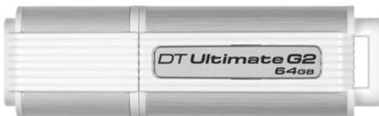
DataTraveler Ultimate 3.0 Generation 2 (G2)