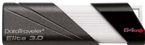
DataTraveler Elite 3.0