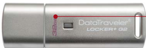
DataTraveler Locker+ Generation 2 (G2)