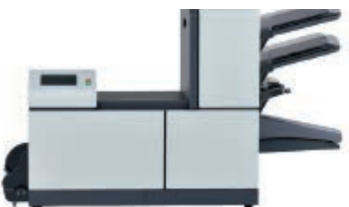
2.5 станции (2xА4+1xА5)