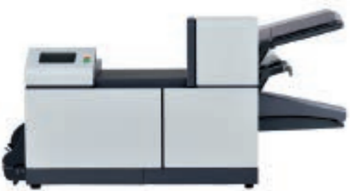
1.5 станции (1xА4+1xА5)