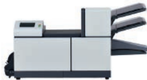
2 станции (2xА4)