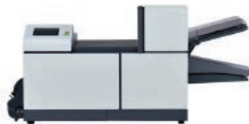
1 станция (1xА4)

ВЫБОР РАЗЛИЧНЫХ КОНФИГУРАЦИЙ ПОЗВОЛЯЕТ ПОДОБРАТЬ ОПТИМАЛЬНУЮ МОДЕЛЬ ДЛЯ ВЫПОЛНЕНИЯ ИМЕННО ВАШИХ ЗАДАЧ